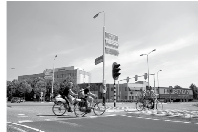
Verdubbelt het aantal rijstroken van rijksweg N282?